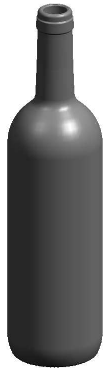
VISTA DEL FONDO